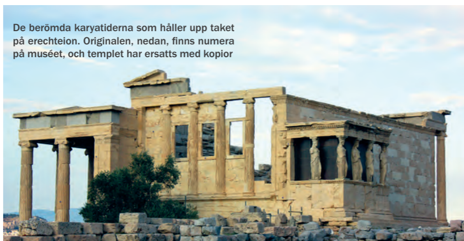
De berömda karyatiderna som håller upp taket på erechteion. Originalen, nedan, finns numera på muséet, och templet har ersatts med kopior

Det är också lätt att ge Tschumi rätt; tack vare glas i tak och golv, atrium genom etage och balkonger, kan besökaren uppleva samma känsla av svidlande storslagenhet som när