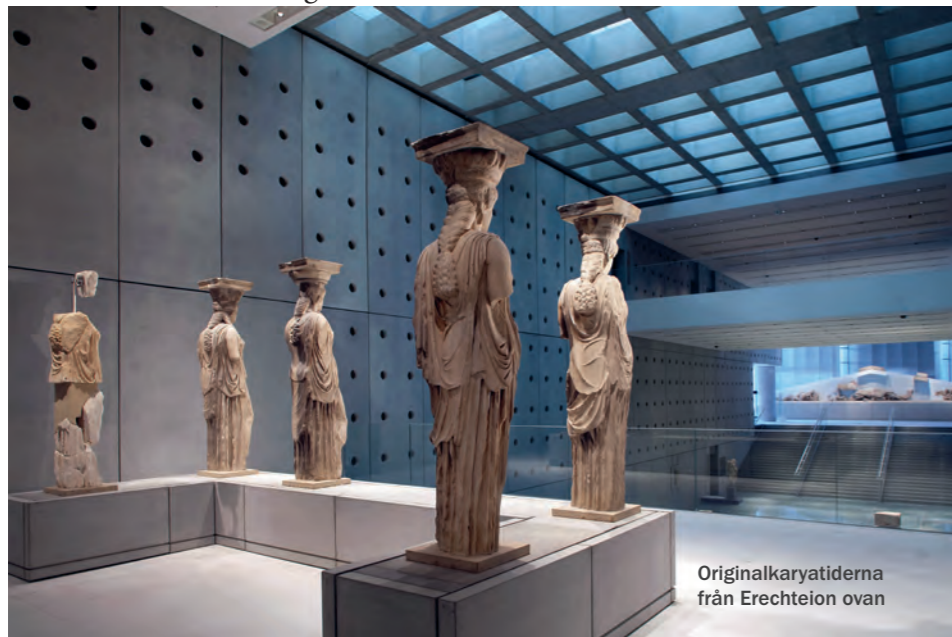
Originalkaryatiderna från Erechteion ovan

Enbart frisen motiverar, trots sin ofullkomlighet, en resa till Athen. ★