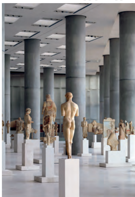
Inget annat museum har tidigare anpassats så för att utnyttja det naturliga ljuset. Det gör också att föremålen uppfattas olika vid olika tidpunkter under dagen.

man passerar Beuleporten och drabbas av de instörtande Propyleerna (ingången till Acropolis), eller vid den första anblicken av Parthenon när man väl kommit upp på klippan.