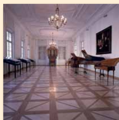
Ett av rummen – det kallas danssalongen

Mozarts residens, eller Mozart-Wohnhaus . Mozart familj flyttade hit till detta betydligt mer luftiga och exklusiva boende 1773 i jämförelse med Getreidegasse 9 då man fick bättre ekonomi. Platsen kallas idag Makartplatz och ligger bara ett stenkast från slottet Mirabell. Den unge Mozart bodde här fram till 1780 då han fick nog av Salzburg eller kanske snarare av sin frustrerande livssituation. Han kom att komponera många betydande arbeten här – ett otal symfonier, serenader, divertimenti och fem konserter för violin och piano. Hela huset utgör idag ett museum.