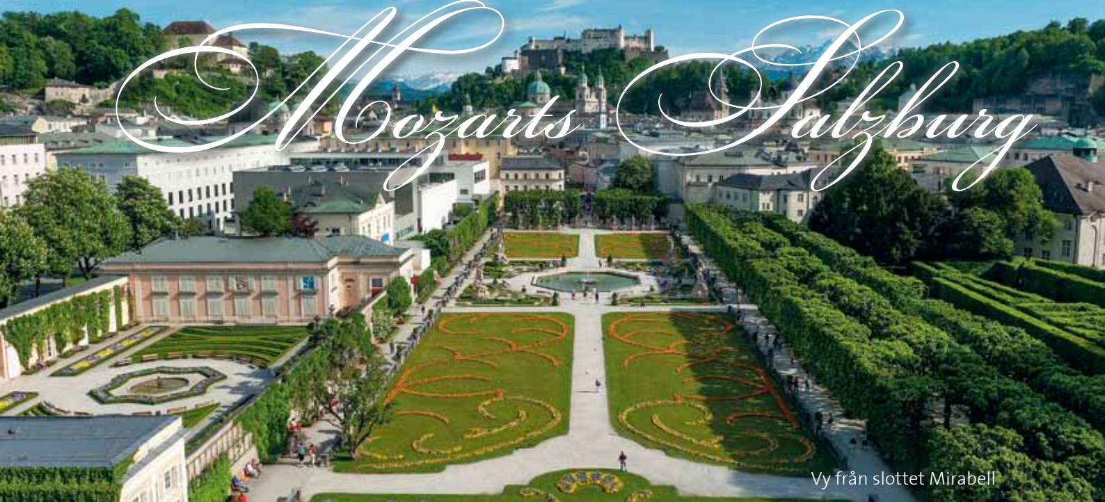
Vy från slottet Mirabell

”Salzburg ist immer eine reise wert”, lyder talesättet, och visst är staden alltid värd en resa. Men kanske allra mest i slutet av juli och början av augusti då den världsberömda musikfestivalen till Wolfgang Amadeus Mozarts minne och ära avhålls. För Salzburgarna