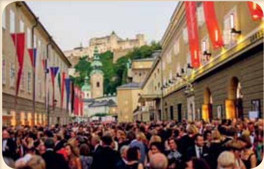
Om man tycker om att umgås med människor bör man besöka Salzburg under stadens berömda festspel

Ett operaförframträdande under festspelen framför den enorma domen i vilken Mozart döptes och mellan åren 1773 och 1777 var han hovorganist här. De mesta av Mozarts verk skrevs för denna katedral.