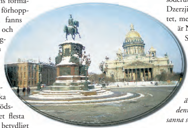
Statyn av Peter den Store på Dekabristernas plats. I bakgrunden den imponerande Isaakskatedralen.

raserad, men ett imponerande restaurationsarbete återställde de vackra centrala delarna till sitt ursprungliga skick redan efter några år. Dessa delar omfattas också idag av UNESCO:s världskulturarvlista. Staden är med sin arkitektoniska profil unik och avgjort en av de vackraste i världen. Palats i pastell avlöser katedraler med