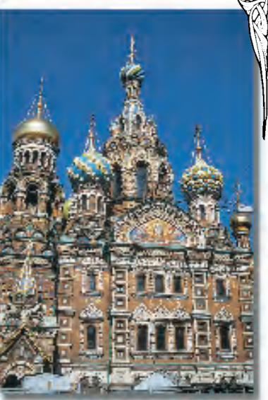
Omringad av nyklassicism bryter Försoningskyrkan trenden med sina lökkupoler i guld och rika utsmyckningar i mosaik.