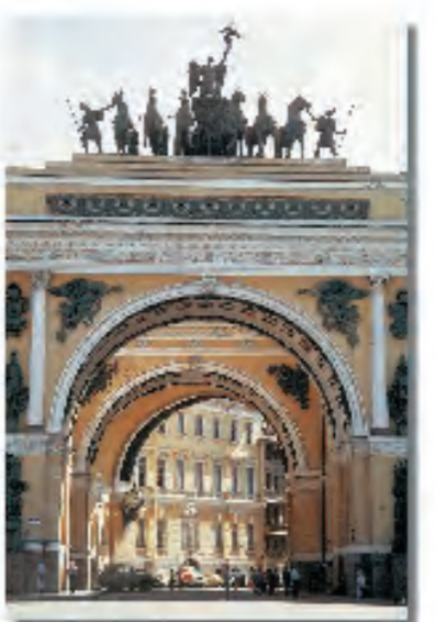
Krigsministerietsvalv kröns av segermonumentet som triumferar över Rysslands seger över Napoleon 1812.