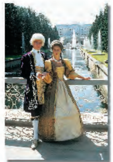
Petershof (1714) ligger ca tre mil utanför centrum och uppfördes av Peter den Store efter segern vid Poltava ville bygga ett residens vid Finska viken som skulle bräcka Versailles.