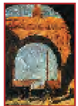
Genom Krigsministeriets valv stormas vinterpalatset. En samtida målning av E. B. Lintott. Bilden nedan är ett nutida foto med samma perspektiv